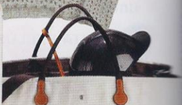
HERMÈS SELLIER PARIS

«MONTAR A CABALLO ES UNO DE MIS HOBBIES». LA BOLSA ES DE HERMÈS (VER PRECIO).