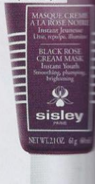
MASQUE-CREAM À LA ROSE NOIR Instantaneous Lift, Hydrate, Revitalize BLACK ROSE CREAM MASK Instant Youth Revitalizing Treatment PARIS NET WT 1.02 oz. 49 g