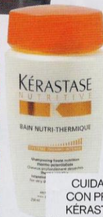
CUIDA SU CABELLO CON PRODUCTOS DE KÉRASTASE. CHAMPÚ NUTRI-THERMIQUE (13,70 €).