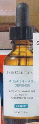
SKINCEUTICALS BLEMISH + AGE DEFENSE POTENT TREATMENT FOR AGING SKIN AND IMPERFECTIONS CORRECT 30 ml / 1 fl.oz.

«¿MI COSMÉTICO S.O.S.? LA MASCARILLA BLACK ROSE DE SISLEY» (104 €).